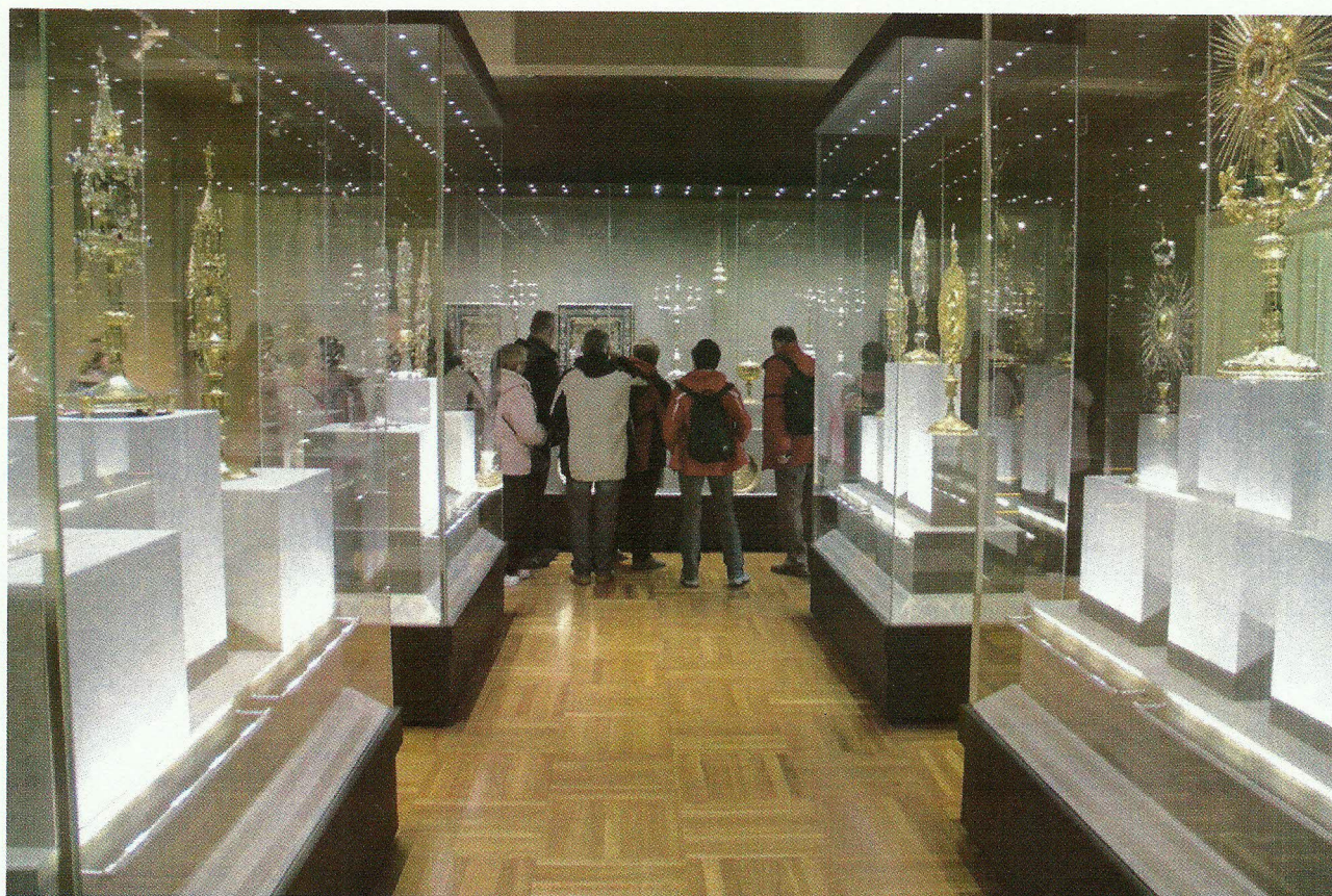
Muzeum Diecezjalne w Płocku - Skarbiec