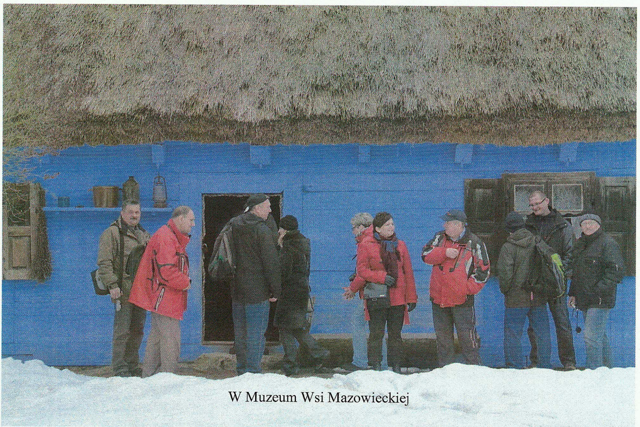
W Muzeum Wsi Mazowieckiej

Piątek spędziliśmy w Płocku. Zaczęliśmy od autokarowej wycieczki po Polskim Koncernie Naftowym „Orlen” oraz zwiedzania Muzeum Diecezjalnego. W południe wysłuchaliśmy płockiego hejnału i odbyliśmy spotkanie w Urzędzie Miasta.