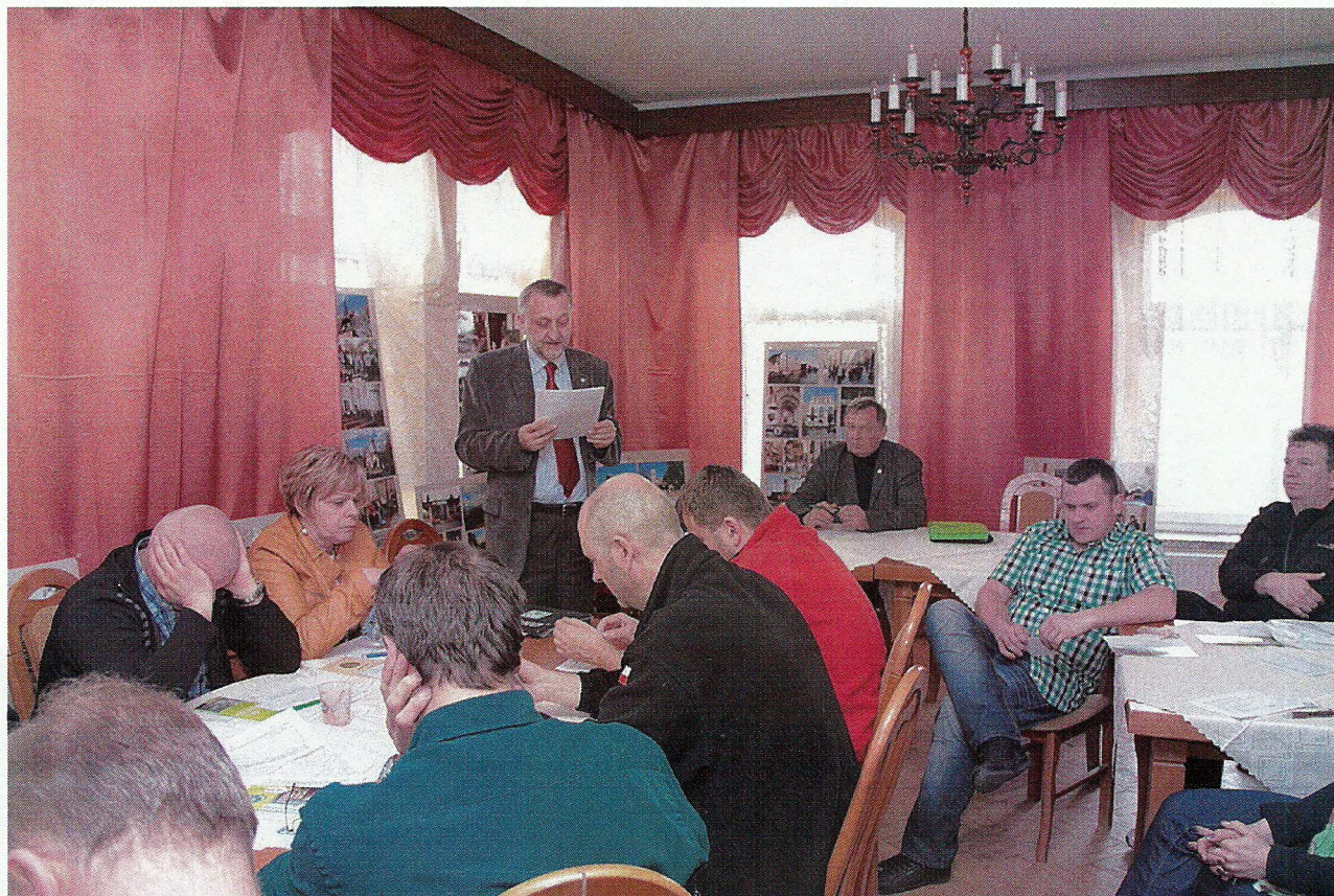
Przewodniczący ustępującej Komisji Turystyki czyta sprawozdanie z działalności w latach 2008-2012

Po otwarciu Zlotu jego uczestnicy udali się do sali konferencyjnej Hotelu PTTK, gdzie odbyło się zebranie sprawozdawczo-wyborcze Komisji Turystyki w resorcie spraw wewnętrznych, podczas którego wyłoniono nowy skład Komisji VII kadencji na lata 2012 – 2016.