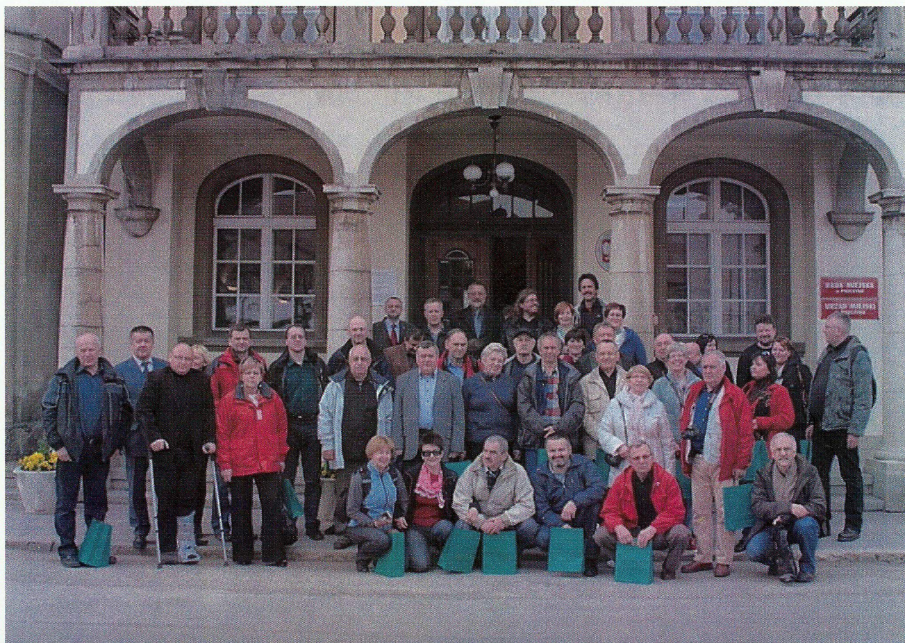
Uczestnicy XXVI Zlotu Aktywu Turystycznego resortu spraw wewnętrznych – Pszczyzna 2012 przed Urzędem Miasta w Pszczynie