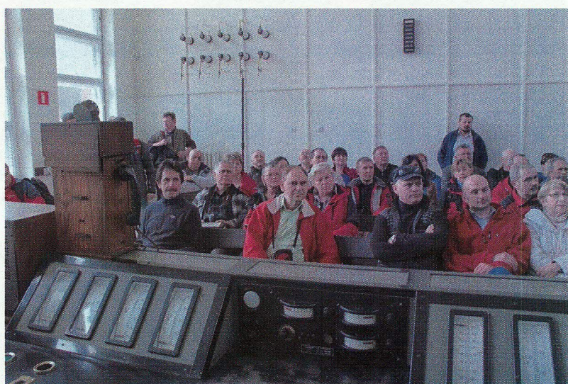
Radiostacja w Gliwicach