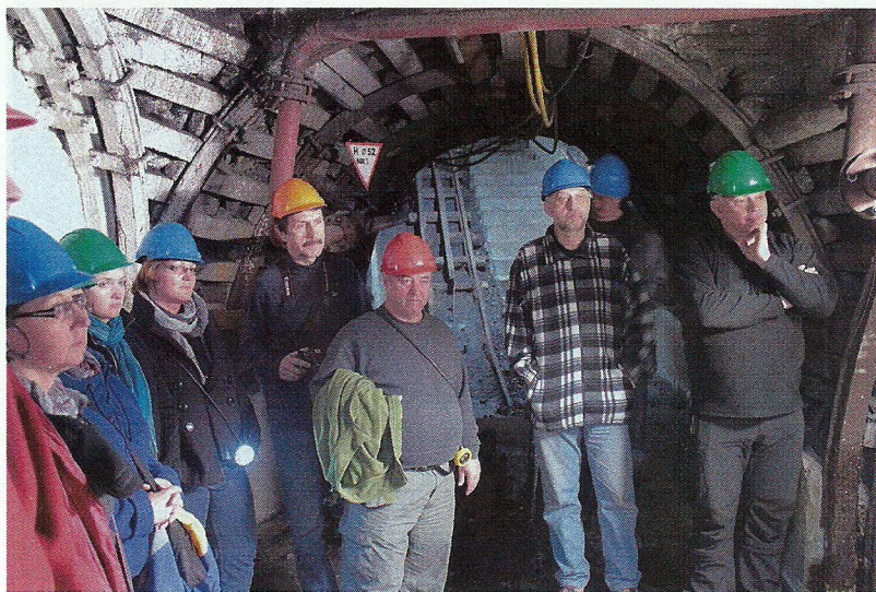
Kopalnia Węgla Kamiennego „Guido” w Zabrzu