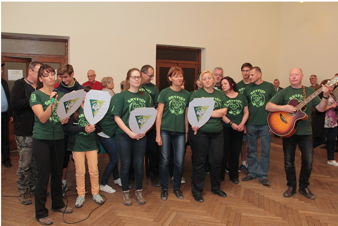
Śpiewają laureaci konkursu piosenki rajdowej „Gryfici” z Koła PTTK nr 39 przy Placówce SG w Szczecinie