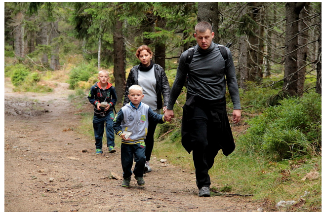
Na trasie – wesoło i rodzinnie