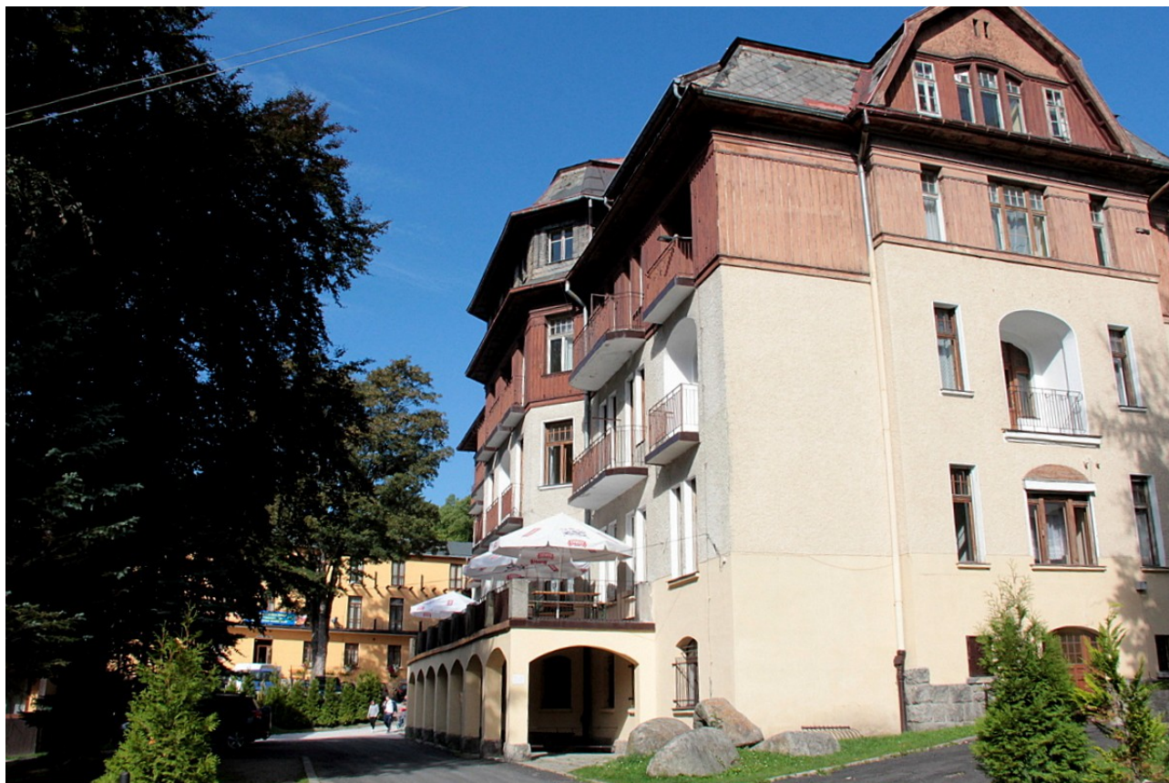
Główna baza Rajdu - „Królowa Karkonoszy” w Szklarskiej Porębie

Komisja Turystyki w resortcie spraw wewnętrznych w dniach 22 – 26 września 2015 roku zorganizowała XXIII Ogólnopolski Rajd Górski Służb Mundurowych resortu spraw wewnętrznych , który odbył się w Szklarskiej Porębie, a bazą Rajdu były ośrodki „Królowa Karkonoszy” i „Halny”.