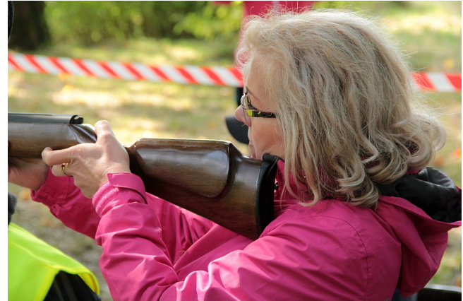
Strzelanie z broni krótkiej i długiej