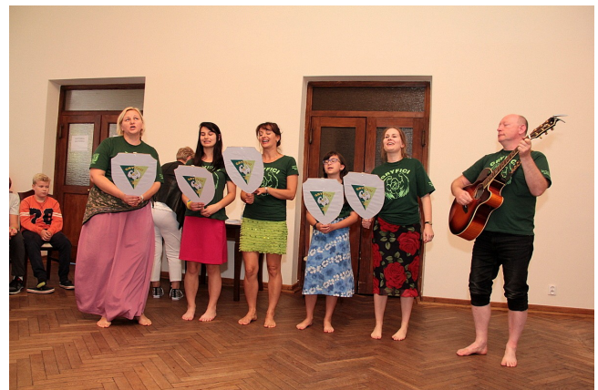
Śpiewają „chłopcy radarowcy” z drużyny „Tramp” z KPP w Pułtusku /II miejsce/