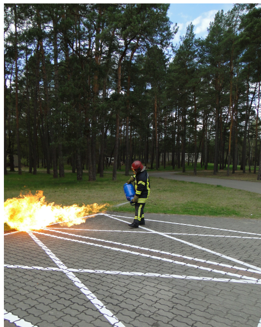
Pokazy w Wojewódzkim Ośrodku Szkolenia Państwowej Straży Pożarnej