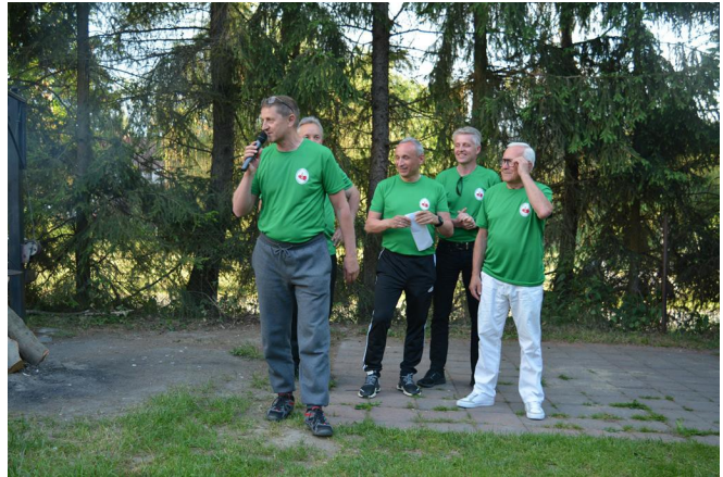
Laureaci konkursu piosenki - „Żwawi emeryci”