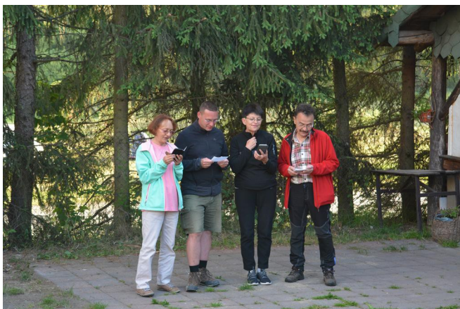
Zbiorcza drużyna pedagogów „Róża Wiatrów”