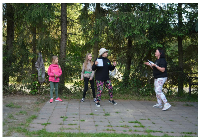
Klub Górski „Orły” z KSP

W konkursie piosenki rajdowej I miejsce zdobyła drużyna „Żwawi emeryci” ze Związku Emerytów i Rencistów SG /5,0 pkt/, II miejsce ex aequo „De-Ptaki” z Gdańska i „Fregata” z MOSG w Gdańsku /4,5 pkt/, a III miejsce zbiorcza drużyna pedagogów „Róża Wiatrów” /3,7 pkt/.