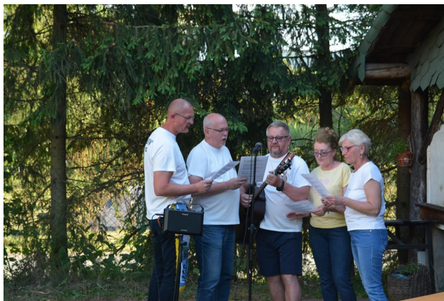
„De-Ptaki” z Gdańska