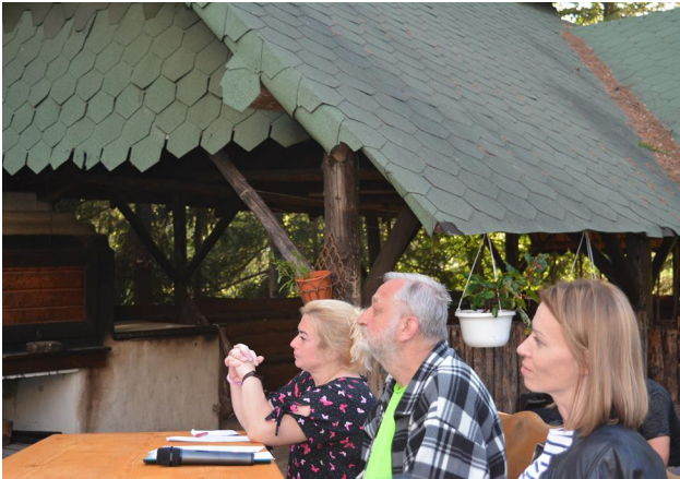
Jury bacznie przyglądało się występom

W środę 15 czerwca br. na trasie z Jasionki do Czarnego odbył się egzamin z topografii , a po zejściu z trasy i obiadokolacji konkurs piosenki rajdowej (własny tekst dot. Rajdu do znanych melodii), w którym wystąpiło 5 drużyn .