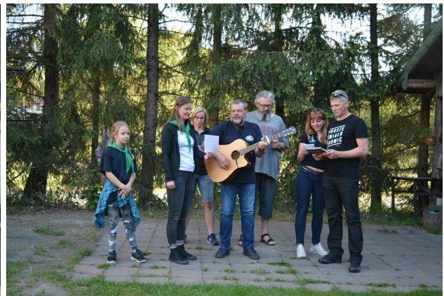
„Fregata” z Morskiego Oddziału SG w Gdańsku