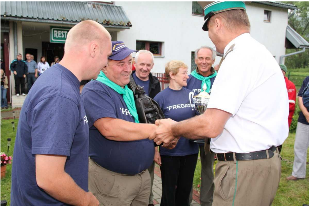
Nagrodę główną – Statuetkę Pogranicznika otrzymały drużyny „Fregata I i II” z MOSG w Gdańsku