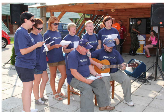
Zdobywcy I miejsca: „Sieradzki Szwędaczek” z KPP w Sieradzu i „Fregata” z MOSG w Gdańsku