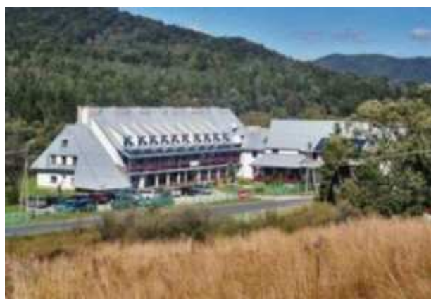
Ustrzyki Górne – dawne schronisko PTTK oraz Hotel Górski PTTK dziś

Honorowy patronat nad Rajdem objęli m. in. Minister Spraw Wewnętrznych i Administracji, Komendant Główny Straży Granicznej, Komendant Główny Policji, Prezes ZG PTTK, Przewodniczący KKW NSZZ Funkcjonariuszy Straży Granicznej, Przewodniczący ZG NSZZ Policjantów, Komendant Bieszczadzkiego Oddziału Straży Granicznej, Podkarpacki Komendant Wojewódzki Policji oraz Wójt Gminy Lutowiska, a współorganizatorem tej ogólnopolskiej imprezy turystycznej była Komisja Środowiskowa ZG PTTK oraz Komisja Turystyki w resorcie SWiA.