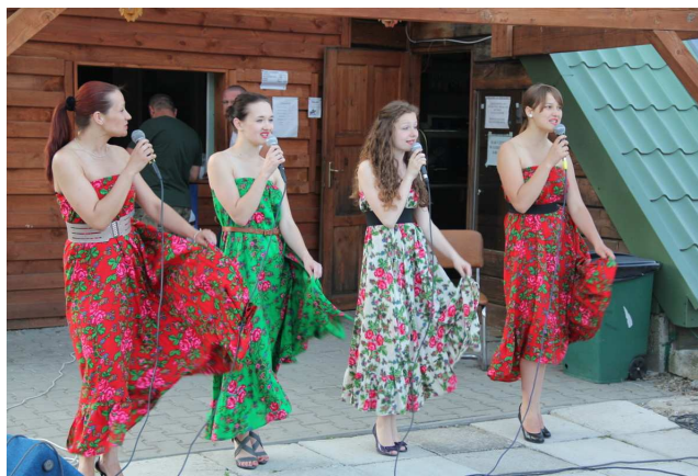
Zespół Biesiadny z Przemysła

Na każdym naszym Rajdzie przeprowadzany jest sprawdzian z orientacji w terenie /marsz na azymut/, a także z zakresu wiadomości o terenie, na którym odbywa się Rajd oraz z historii i tradycji Straży Granicznej i Policji.