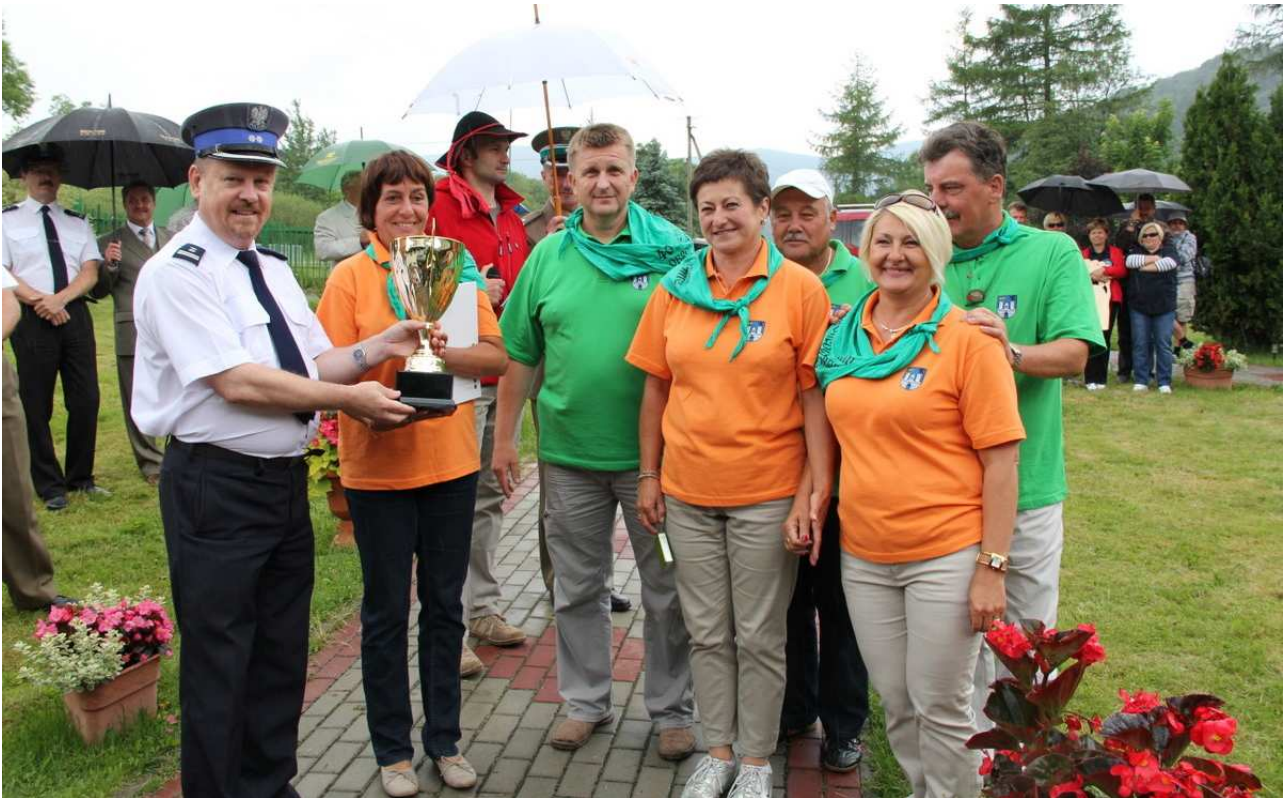
Puchar Ministra SWiA odbierają zdobywcy I miejsca - drużyna „Cieniasy” z KMP w Częstochowie